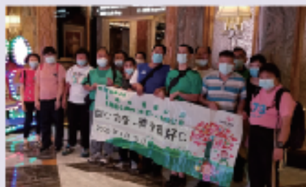
用餐後大家十分滿足地進行大合照