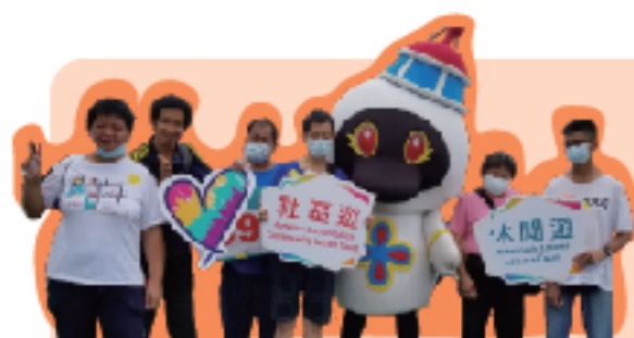
與澳門旅遊吉祥物「安安」合照

下半年開始，隨著澳門疫情的緩，澳門特區政府都推出了一系列舒困惠民的措施，如電子消費卡、【心出發·游澳門】，本會亦積極響應，組織智障員工及家長一共參加以放鬆身心，重新認識澳門。