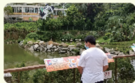
親親大自然，遊覽石排灣郊野公園