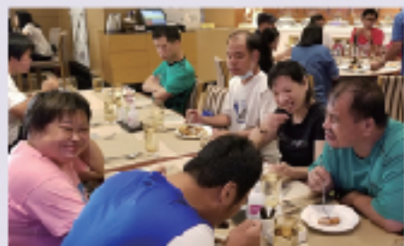
用餐前後亦不忘要消毒雙手