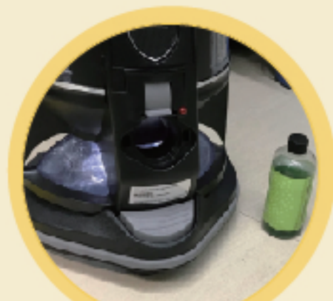
公司持續進行空氣淨化