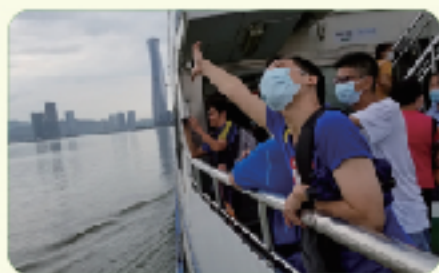
欣賞內港及沿岸景色

因應員工們外出旅行的熱切期待以及鼓勵他們融入社區，積極參與社區活動，擴大社交圈子，為此，毅進社有限公司組織智障員工及其家長一同參與由澳門特區政府推出的【心出發·遊澳門】的社區線，享受一個擁抱陽光海水遊之旅。