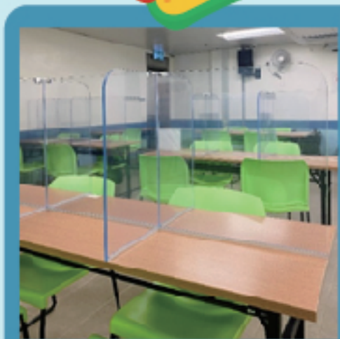
飯堂加裝防飛沫膠板

疫情初期，根據澳門社工局指引，本會轄下附屬毅進綜合服務中心不對外開放。除了日常的線上致電聯絡提供個案協助外，中心工作隊在開始逐漸恢復運作後，於非辦公時間到不同機構進行清潔工作，避免人流聚集。同時中心職員向工作隊學員講解相關防疫諮詢，如工作期間必須戴上手套和口罩，防護裝備的正確使用程序及使用後如何處理等措施，為學員做足防護措施。