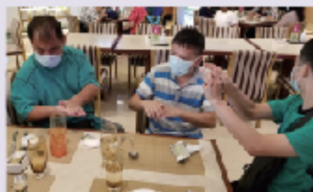
大家正愉快地享用自助餐