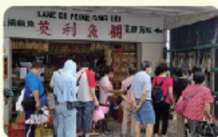
到訪路環市區，了解路環的特色